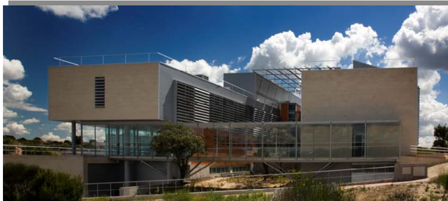
Centro de investigación CEDINT/CESVIMA