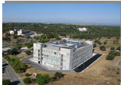
Centro de Biotecnología y Genómica de Plantas CBGP

Los ejes básicos de actuación del CEI Montegancedo giran en torno a la dimensión internacional de la actividad universitaria, la innovación abierta en cooperación con otras entidades, el desarrollo sostenible y la integración social , integrado en un espacio natural privilegiado.